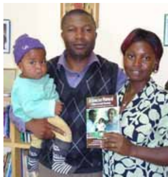
Manželé se Stručnou učebnicí

1) Kontraktivní kultura. Jako všechny africké země je i naše země pod tlakem, aby uskutečnila západní sexuální, feministickou a kulturní revoluci pomocí velmi nebezpečného nástroje známého jako Maputo Protokol. Africká země, která odmítne tento smrtící nástroj, nedostane pomoc od žádné západní země. Maputo Protokol propaguje antikoncepci a potraty na všech úrovních zdravotní péče pod maskou reprodukčního a sexuálního zdraví. Ve všech zdravotních zařízeních, ať už jsou ve venkovské džungli nebo v centru města, jsou antikoncepční metody neoddelitelnou součástí služeb. My jako apoštolát PPR musíme být „hlasem volajícího na poušti“, který nelze umlčet. Je nutné potřeba, aby všechny organizace PPR spolupracovaly a mluvily jedním hlasem. Jsme přesvědčeni, že spolupráce mezi LPP ČR a Kamerunem je krokem správným směrem pro Boží slávu.