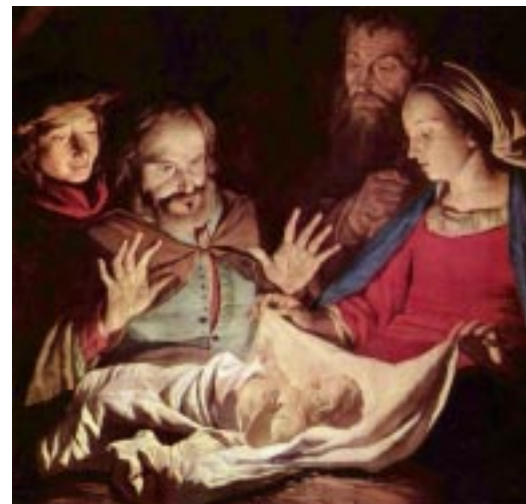
Kristus – světlo světa

vyjádřit svou víru, že je dítětko Ježíš nejdůležitější osobou v té scéně, nebo vůbec. Kristus je světlo světa; přišel na svět jako dítě – zrozené z ženy. Narodil se jako každý z nás, ale do nouzového ubytování. Narodil se do špíny chléva a ještě horší špíny našich hříchů. Pokora a láska Boha, který se snížil na naši úroveň, je podivuhodná.