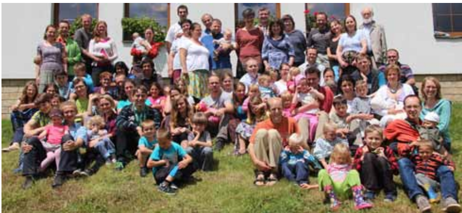
Účastníci konference LPP ve Vesmíru v Orlických horách, červen 2017