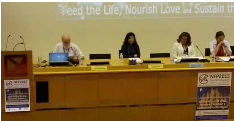
Světový kongres PPR: „Udržovat život, žít lásku a zachovat rodinu“ přednáška o ekologickém kojení